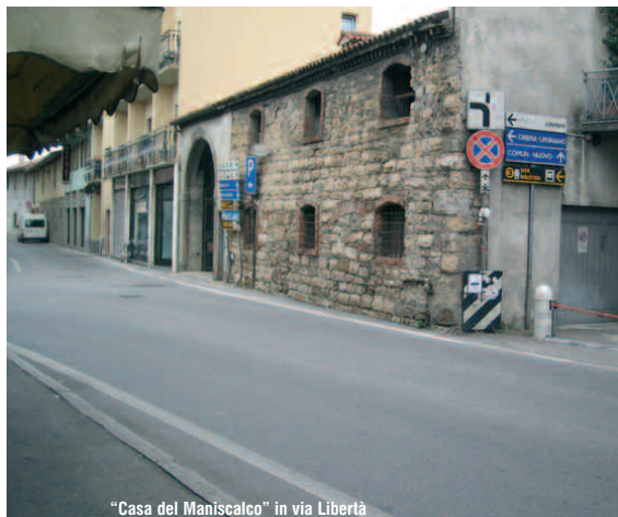
"Casa del Maniscalco" in via Libertà