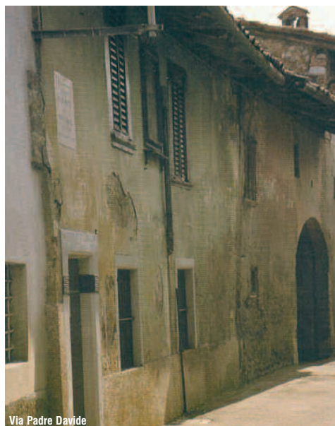
Via Padre Davide