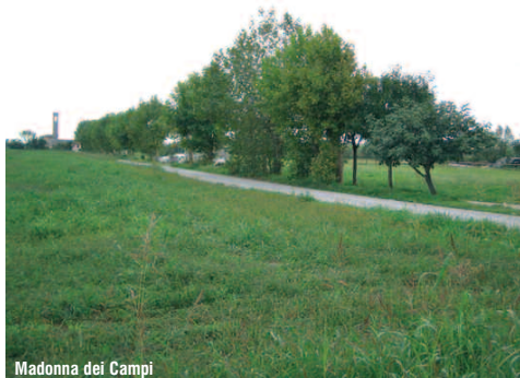
Madonna dei Campi