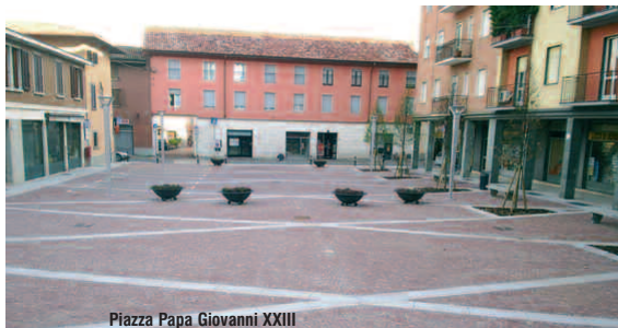
Piazza Papa Giovanni XXIII

L'ufficio personale si occupa del trattamento economico dei dipendenti comunali e di tutte le pratiche giuridiche che li riguardano, applicando il contratto collettivo nazionale di lavoro ed il contratto decentrato. L'ufficio segue anche le procedure per i concorsi pubblici finalizzati all'assunzione di personale e per le chiamate numeriche tramite l'ufficio di collocamento.