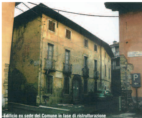
Edificio ex sede del Comune in fase di ristrutturazione